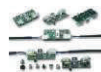
WA9 lampki ostrzegawcze LED na ramię, montowane w listwach ochronnych WA2/WA6 - 6 szt 320,00 390,40 brutto