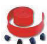
WA2 listwy ochronne, gumowe, czerwone, na ramię WA1