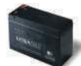
B12-B akumulator 12V 6.0 Ah