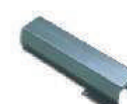
WA8 uchwyt mocujący do ramienia tubowego WA7