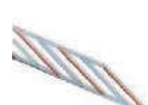
WA13 listwy aluminiowe, zabezpieczające, pod ramię płaskie, w odc. 2 m 250,00 305,00 brutto