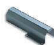
WA4 uchwyt mocujący do ramienia tubowego WA3