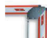
WA14 łącznik do ramienia łamanego - płaskiego WA1