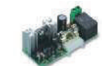
CARICA karta ładowania akumulatorów