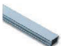
WA21 ramię aluminiowe, płaskie 36 x 94 x 6250 mm