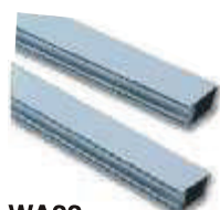
WA22 ramię aluminiowe, płaskie, z łącznikiem, 2-częściowe 36 x 94 x 3125 mm