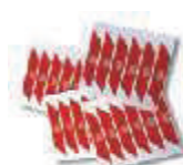
WA10 nalepki ostrzegawcze na ramię szlabanu (24 szt)