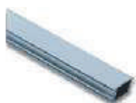
WA1 ramię aluminiowe, płaskie 36 x 73 x 4250 mm