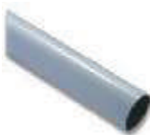
WA7 ramię aluminiowe, tubowe 90 x 6250 mm, zalecane do wietrznych miejsc