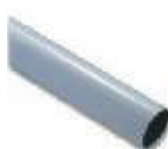
WA3 ramię aluminiowe, tubowe 70 x 4250 mm, zalecane do wietrznych miejsc