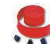
WA6 listwy ochronne, gumowe, czerwone, na ramię WA21, WA22